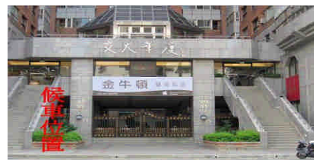
德馨大廈 建中路上，德馨大廈門口。